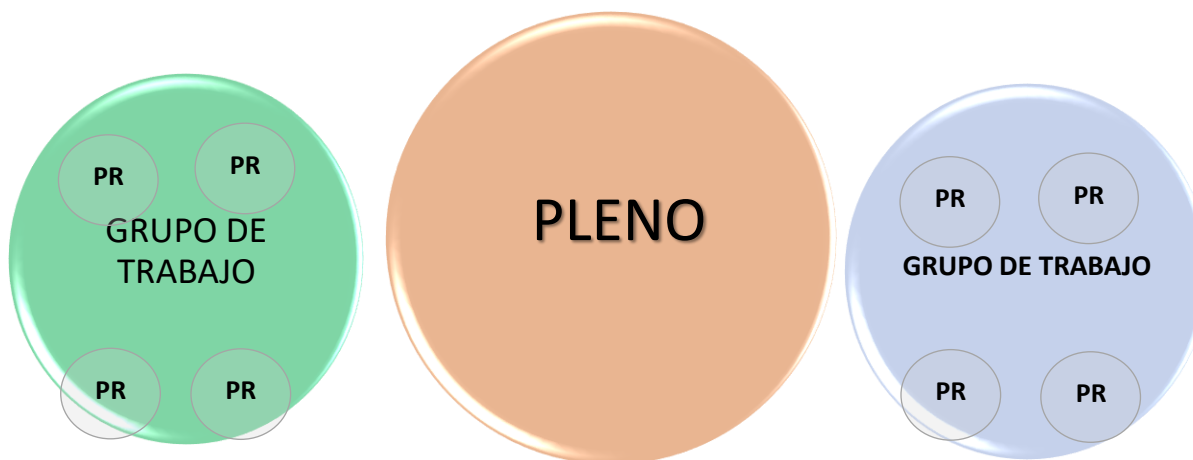
Figura 1. Representación gráfica de los Grupos de Trabajo y Puntos de Recuento en una Sesión de Cómputo.

Cada grupo de trabajo estará conformado por consejerías electorales, supervisores y capacitadores asistentes electorales locales (que llevarán a cabo tareas de auxilio), personal administrativo permanente y temporal del Instituto, así como representaciones titulares y suplentes de partidos políticos y, en su caso, candidaturas independientes.