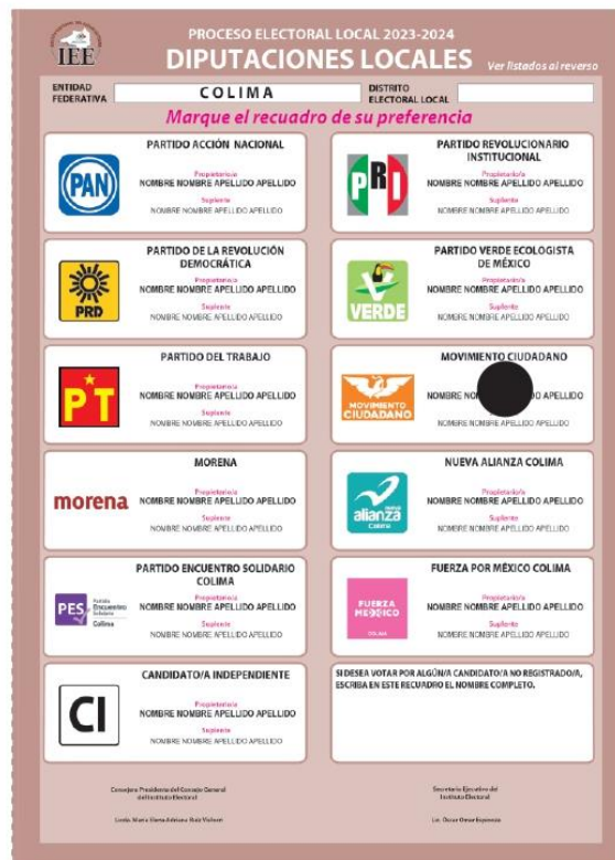
Cuadernillo de consulta sobre votos válidos y votos nulos Cómputos Locales. Proceso Electoral Local 2023-2024.

Ejemplos de votos válidos para partidos políticos