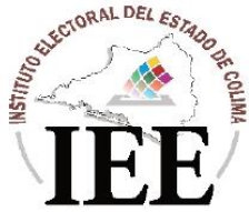
TABLA DE RESOLUCIONES JURISDICCIONALES